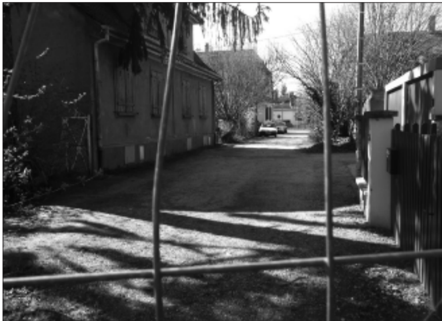
Condamnée par ses propriétaires, la rue Salomon pourrait devenir une zone de rencontre.

Les habitants de la rue des Erables perdent patience. « Je passe quand même », avoue Isabelle Bret. Jean-Louis Grasser, qui ne veut pas que