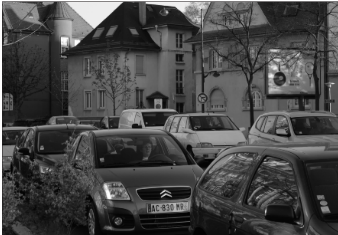
A proximité du Palais de la musique et des congrès, la circulation est saturée, même en dehors de tout événement d'ampleur.

Autre défaut, l'aéroport international de Strasbourg, situé à Entzheim, à dix minutes en train du centre, ne propose qu'une offre de vols très limitée. Une quarantaine par jour. La plupart des destinations concernent les principales villes françaises (Paris, Nantes, Toulouse, Marseille ou Nice) et très peu l'international, à part Prague, Amsterdam, Madrid, Bruxelles, Djerba et Tunis. Il n'existe, en outre, aucun long courrier direct vers la