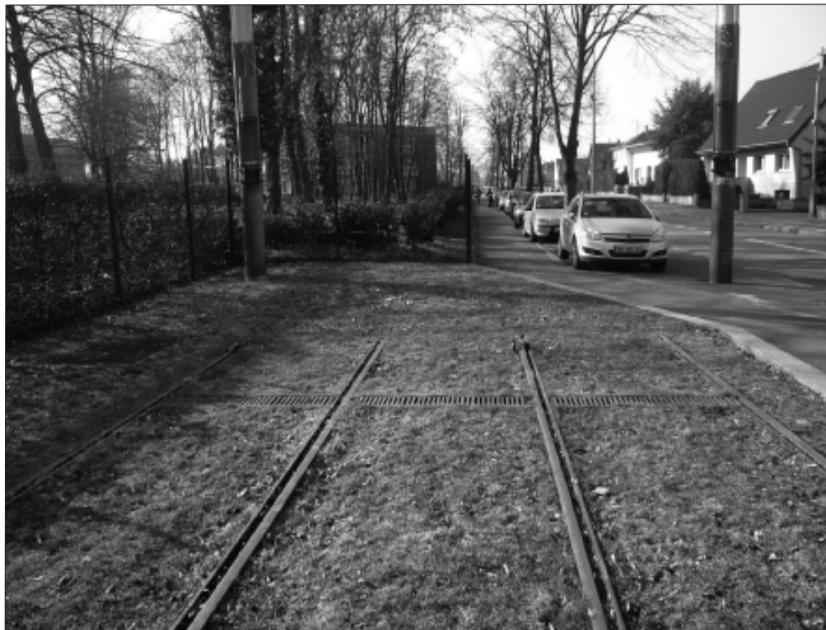
Le tram A s'arrête rue Lixenbuhl. Il faudra 1,8 km de voie supplémentaire pour relier le centre d'Illkirch.