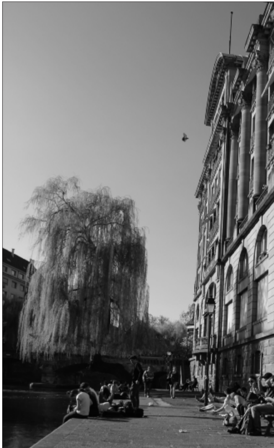
Avec les beaux jours, les berges du bâtiment de l'Esca sont prises d'assaut jusqu'au milieu de la nuit, empêchant les habitants de dormir.

Dix minutes plus tard, un groupe de cinq jeunes garçons les remplace sur le banc. Ils s'interrogent sur leur consommation d'alcool : « Qu'est-ce qu'on fait ?