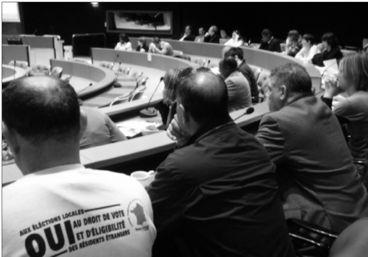
Première séance plénière de l'année pour le Conseil des résidents étrangers, le 24 mars, dans les locaux de la CUS.

La composition de ce dernier collège reflète la diversité des origines au sein de la population strasbourgeoise. Ainsi, quatorze personnes proviennent du Maghreb, neuf d'Afrique subsaharienne, six de Turquie, trois d'Amérique, quatre d'Asie, du Proche et du Moyen-Orient, ainsi