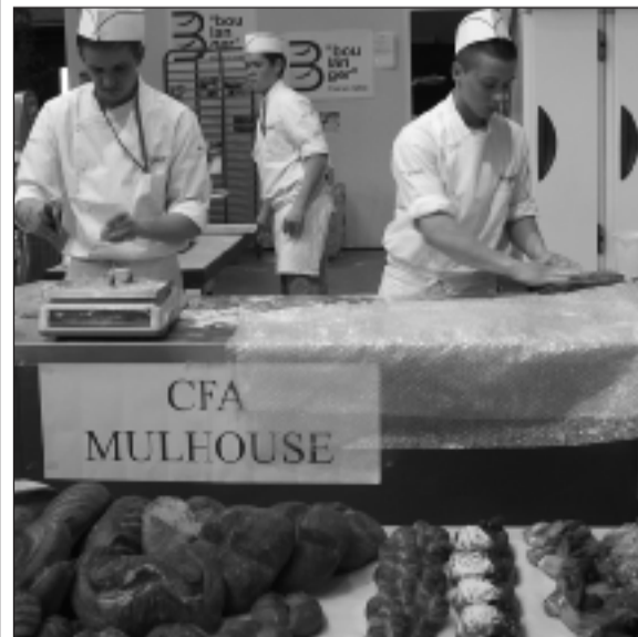
Par manque de place. Une trentaine d'exposants n'ont pu participer à Egast.

De quoi voir plus grand ? « Nous sommes à saturation. Il n'y plus d'espace disponible. Une trentaine d'exposants n'a pas pu participer au salon. » Une contrainte dont Egast ne pourra s'affranchir sans nouveau parc des expositions.