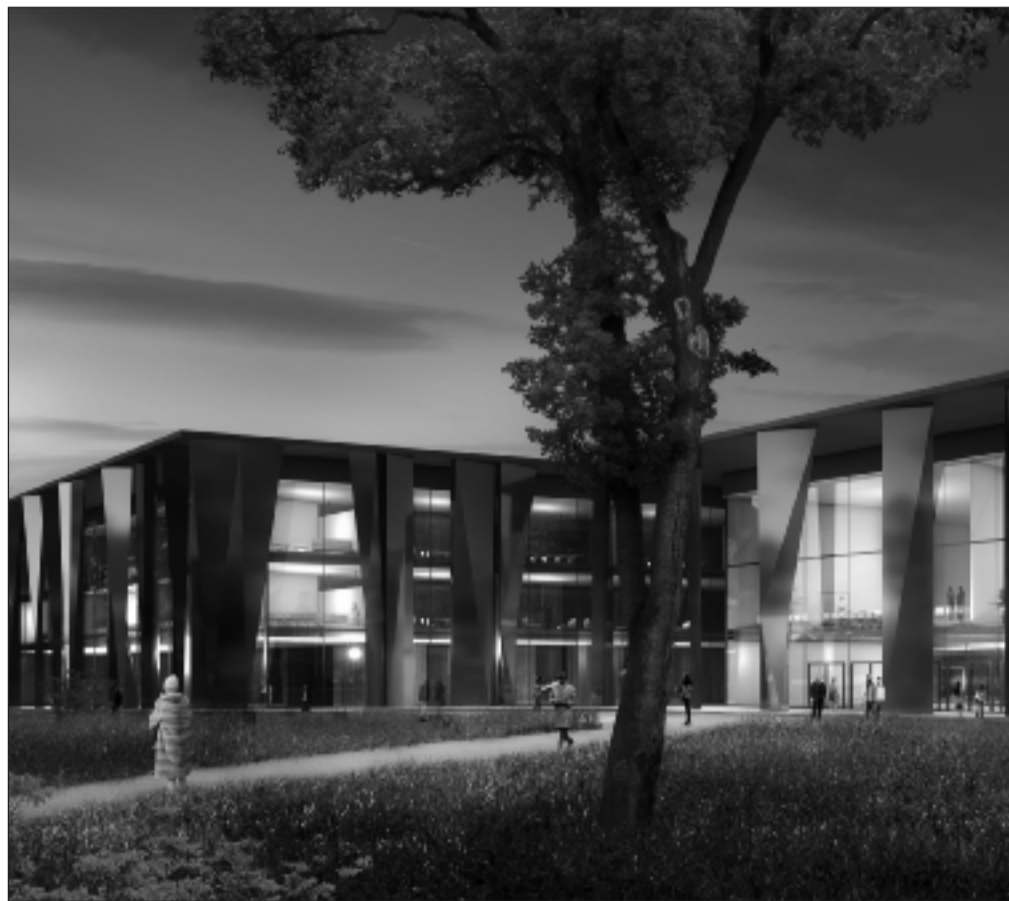
Visuel du projet de rénovation du Palais de la musique et des congrès (PMC) réalisé par le cabinet d'architectes Rey-Lucquet et associés.

Ces chiffres flatteurs masquent une réalité moins reluisante. A l'international, Strasbourg est à la traîne. En 2010, sur 149 rendez-vous d'affaires organisés au PMC, seulement un tiers était de dimension nationale et internationale. Un chiffre en baisse par rapport à l'année précédente, tandis que les manifestations régionales, comme le salon de la gastronomie Egast, ont augmenté : 106 en 2010 contre 86 en 2009. La Foire, quant à elle, n'a plus