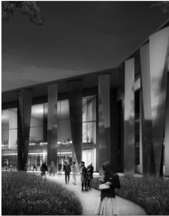
Architectes Rey-Lucquet et associés et Dietrich-Untertrifaller.