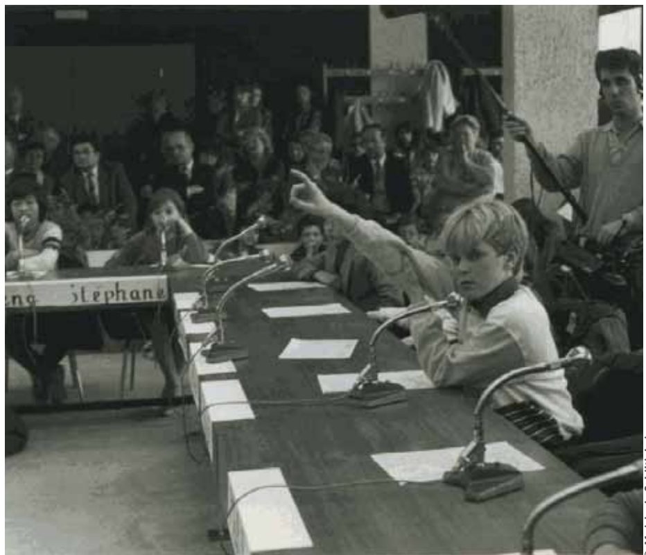
26 mars 1985 : le conseil des enfants travaillait à l'époque sur l'aménagement du parc des Malteries.