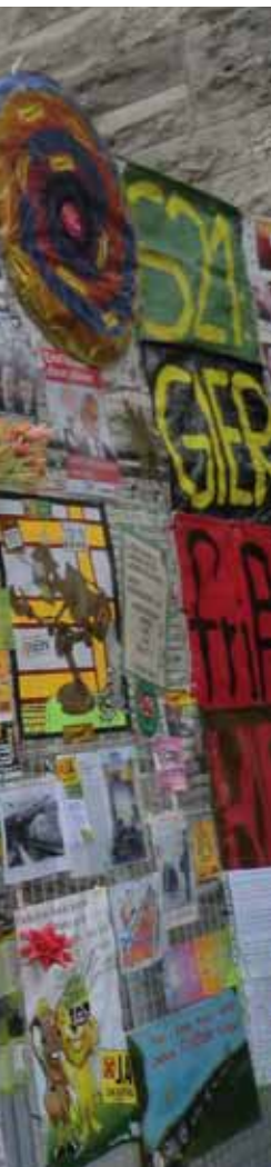
Devant le chantier de la gare, les opposants ont transformé les grillages de protection en mur d'expression.