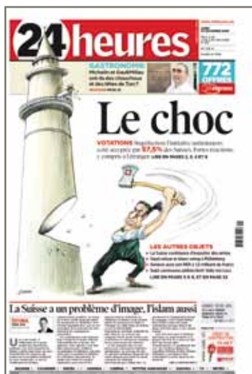
La une du quotidien suisse 24 heures au lendemain de la votation sur les minarets.