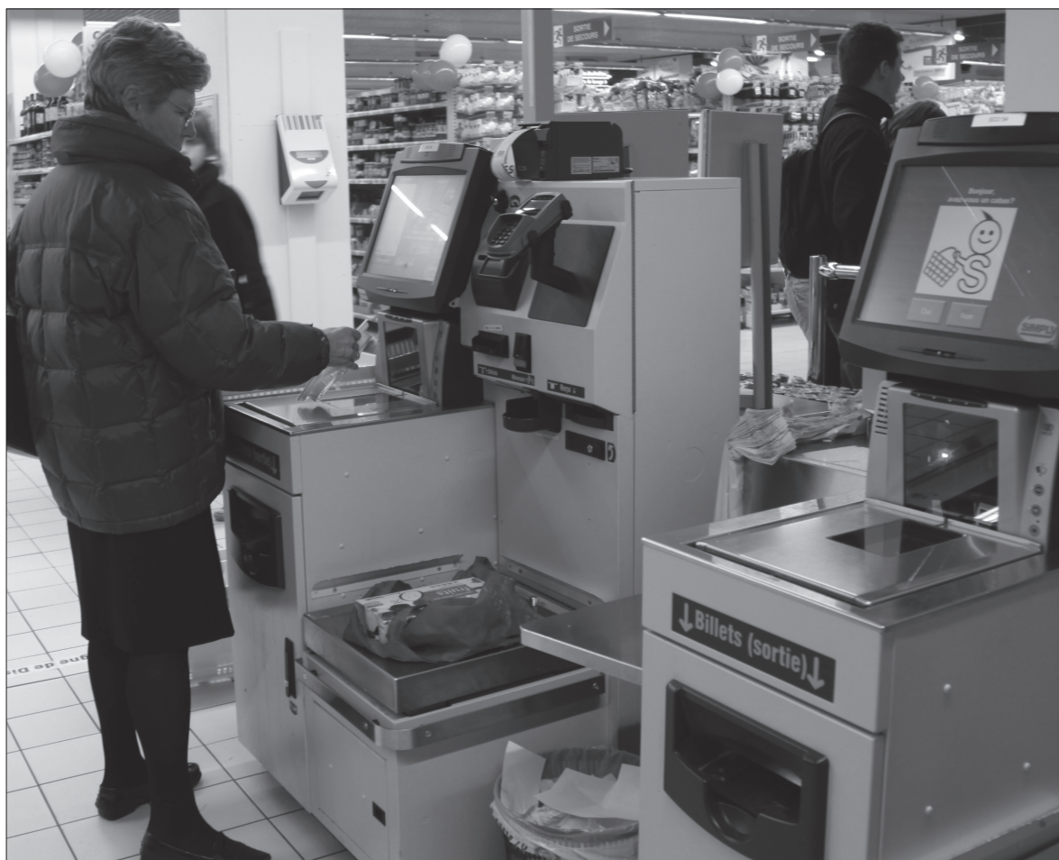
Caisses automatiques au Simply Market des Halles, à Strasbourg.

C'est le cas de Nathalie, caissière depuis plus de 20 ans. Elle souffre de tendini-