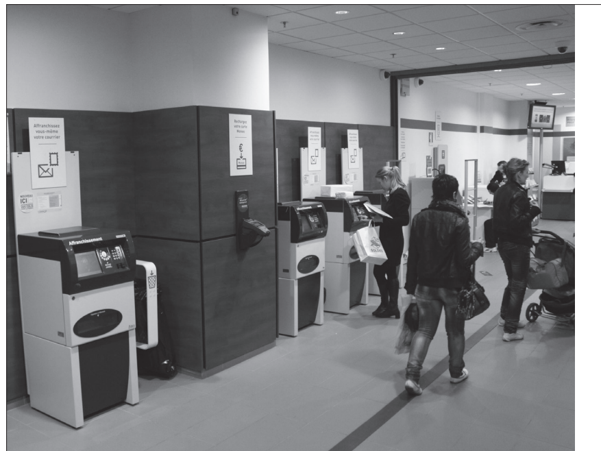
« Une machine ne fait pas grève, ne prend pas de congé et travaille 24h/24 ».

Non, pas nécessairement. Il faut voir les effets d'une manière plus globale. On peut par exemple demander plus de polyvalence aux caissières. Les entreprises cherchent à gagner du temps et à maximiser les profits en mettant la bonne personne au bon endroit.