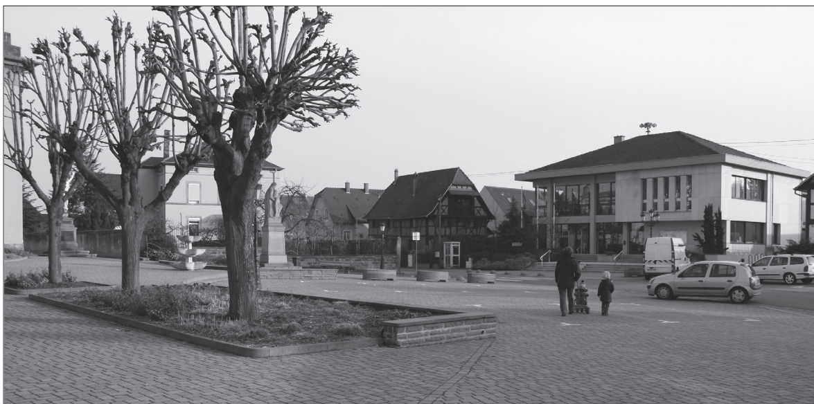
La place de la mairie de Reichstett : du plus bel effet, mais peu fréquentée.