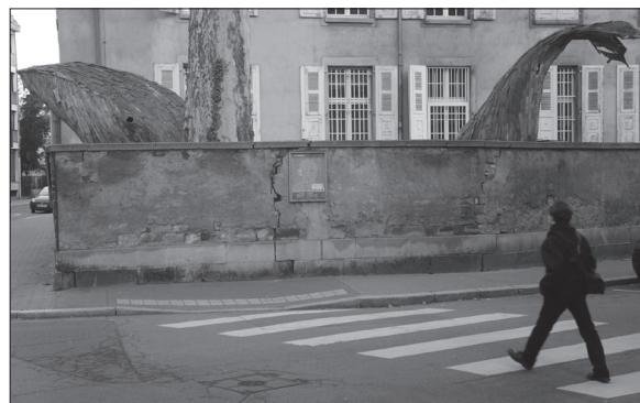
La baleine de la rue Saint-Guillaume, à Strasbourg.

borde sur la rue de l'Académie. Elle est à présent reconnaissable grâce à ses yeux. Le cétaqué semble de taille réelle. Il est en tout cas impressionnant même si le reste de son corps est caché par une façade de près de deux mètres. La baleine, clouée au sol, n'est pas bleue et n'a pas la peau lisse. Elle est marron clair et foncé, entièrement sculptée à partir de petites planches en bois. Un matériau qui correspond bien à son environnement ; elle jouxte un arbre, imposant par sa taille. Échouée dans le jardin de l'École supérieure des arts décoratifs, à quelques pas de l'III, la baleine de la Krutenau vit comme un poisson dans l'eau.