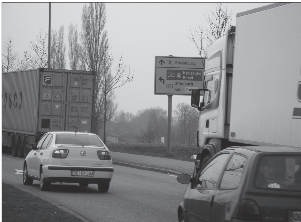
70% des véhicules qui franchissent le Pont de l'Europe entre Strasbourg et Kehl sont originaires de la région.

Kehl a ainsi décidé en 2010 de faire appel à la société de conseil Fichtner, spécialisée dans les projets d'infrastructures, afin de réaliser une cartographie du bruit sur le territoire de la ville et de proposer des solutions. Interdiction de circulation des poids-lourds la nuit, réduction du seuil de vitesse