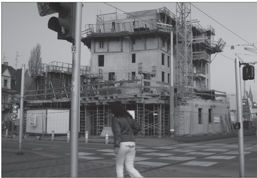
Un HLM en construction place du Schluthfeld.