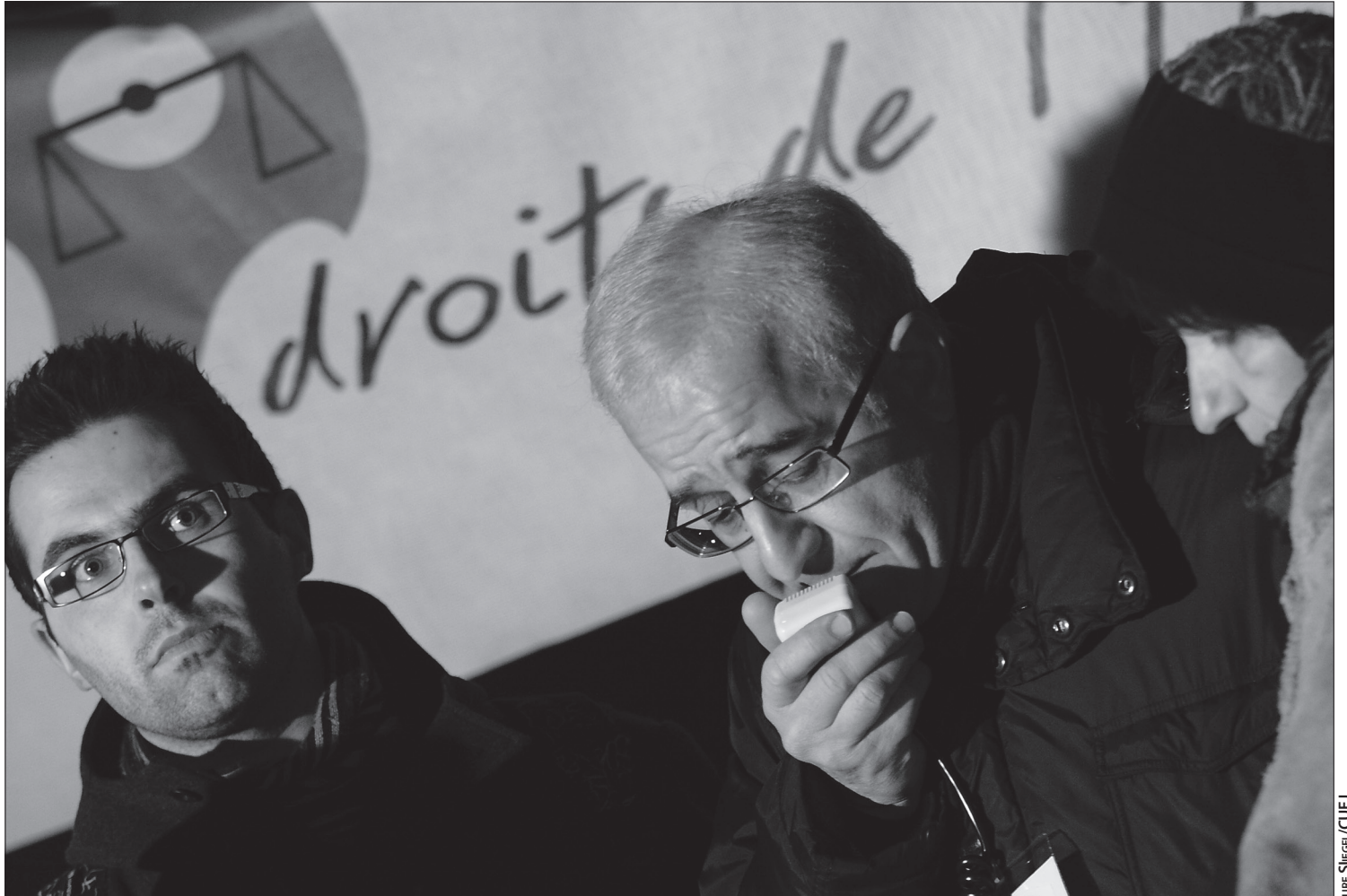
Les associations contre le racisme étaient rassemblées pour crier leur ras-le-bol, mercredi 2 février, place de la République.

Confrontés depuis quelques mois à une vague de gestes xénophobes, les responsables locaux cherchent les réponses les plus efficaces. Entre sensibilisation et répression.