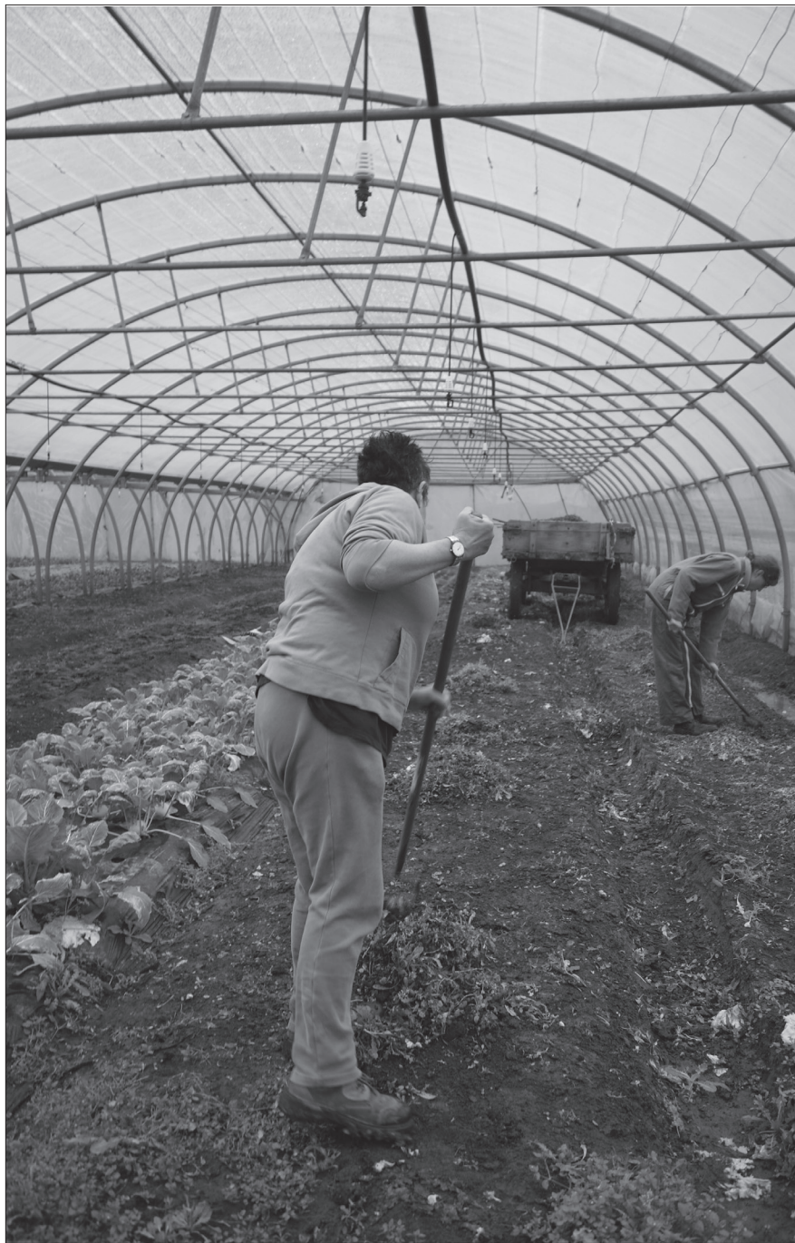
Le terrain doit être désherbé pour accueillir la culture des fruits et des légumes, d'été, réalisée sur une superficie de 5000 m 2 .

L'idée lancée, une commission de bénévoles de l'association s'est mise en place, avec le soutien de deux étudiantes de l'uni-