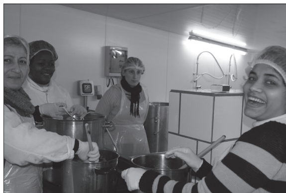
Les salariées préparent de la confiture qui finira en pots, dans les paniers proposés aux adhérents.

La distribution des légumes s'effectue dans la vingtaine de points de dépôts à Strasbourg, Schiltigheim et Eschau. Dix adhérents suffisent pour en créer un nouveau. Les prix des paniers varient de 7 à 15 euros.